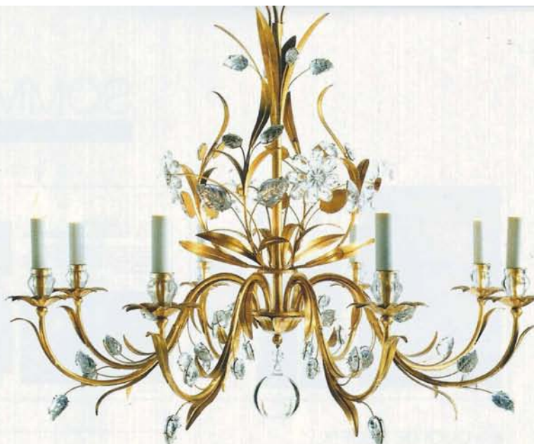
FEUILLAGES. Lustre 8 lumières - Fer et cristaux de Bohême Dimensions : H 60 x Ø 75 cm. 4 100 € (Bagues Paris).