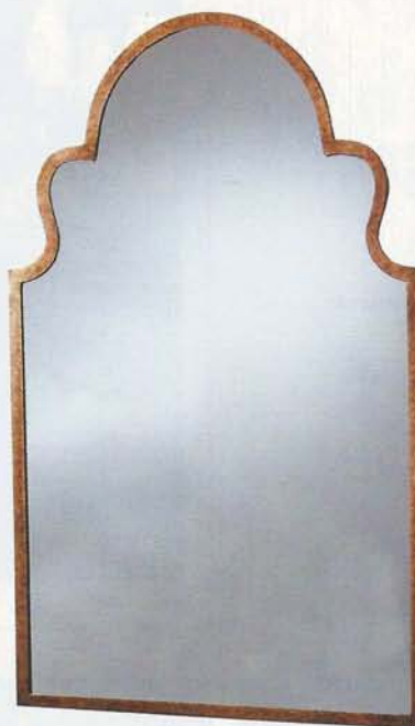
TEBESSA. Miroir en bois 187,95 € (Joss and Main).