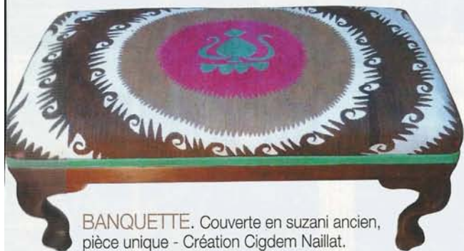
BANQUETTE. Couverte en suzani ancien, pièce unique - Création Cigdem Naillat. Dims : 40 x 60 cm. 900 € (Maison Ottomane).

Côté déco, le bois patiné et les matières nobles rappellent toute la chaleur des anciennes maisons de campagne. Laissez-vous séduire par le charme de l'Italie.